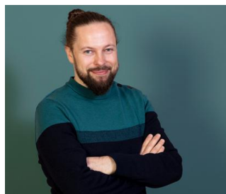
2022 RÉMI DAVID «Mourir avant que d'apparaître» (Editions Gallimard 2022)