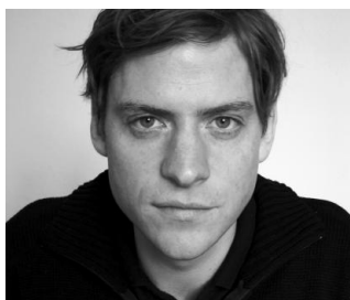
2014 ROMAN EHRlich «Das kalte Jahr» (Dumont 2014)