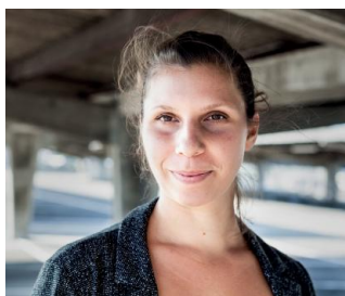
2018 GIANNA MOLINARI «Hier ist noch alles möglich» (Aufbau-Verlag 2018)