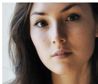
2016 ELISA SHUA DUSAPIN «Hiver à Sokcho» (Editions Zoé 2016)