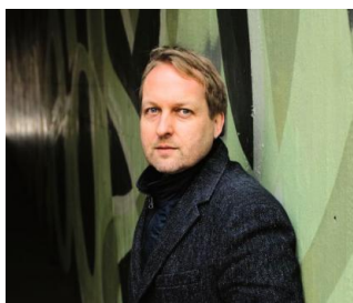
2020 THILO KRAUSE «Elbwärts» (Hanser Verlag 2020)