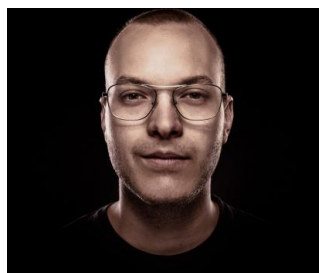
2018 GABRIEL ALLAIRE «Pas de géants» (Leméac Éditeur 2017)